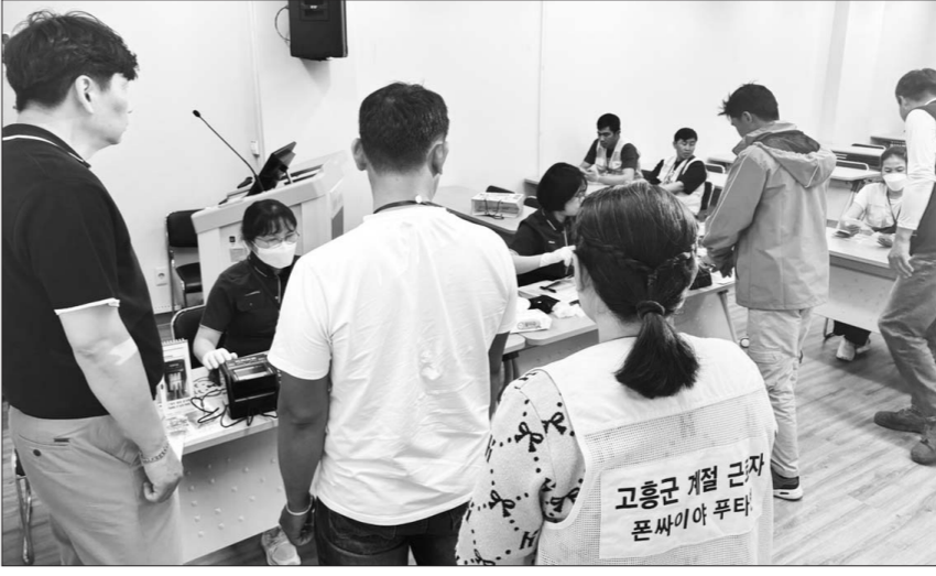
지난 23일 고흥군 고흥읍 고흥문화종합회관에서 '찾아가는 이동 출입국 서비스'가 이뤄지고 있는 모습.

대, 서영대, 전남대, 조선대, 호남대 등 7개 대학과 강진·고흥·곡성·나주·보성·화순 등 6개 지자체를 찾아 모두 20차례 서비스를 운영했다. 이를 통해 유학생 1132명과 계절근로자 893명 등 2025명의 등록을 지원했다. 목포출장소도 무안·영암·완도·진도·해남 등 5개 지자체에서 12차례 이동 서비스를 실시해 계절근로자 2366명과 전문인력 87명 등 2453명의 등록 절차를 마쳤다.