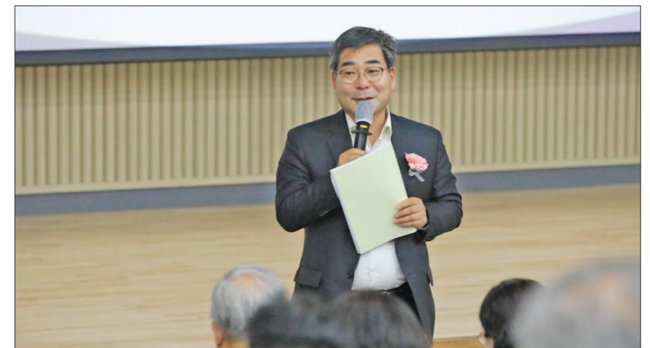
박중원 군수가 지역민에게 당선 소감을 전하며, 앞으로의 군정 방향에 대해 설명하고 있다.