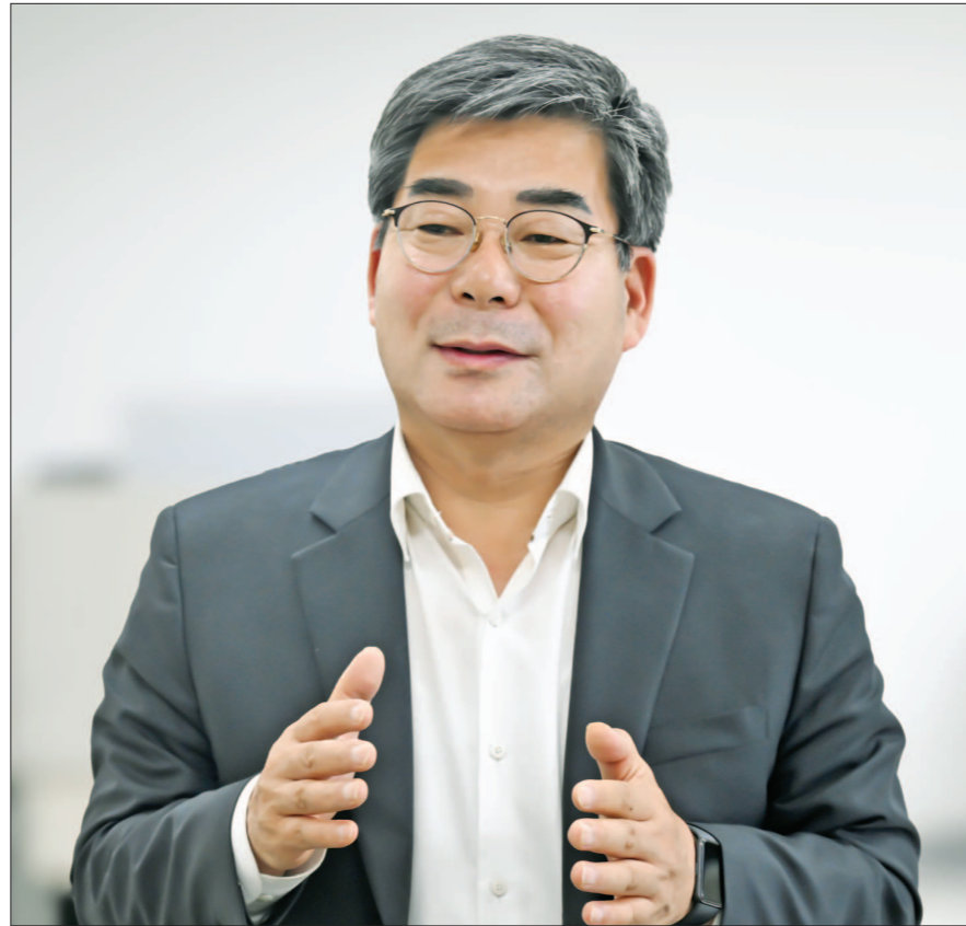
박중원 담양군수가 “20년 동안 현장에서 다져온 모든 네트워크와 실천 경험을 쏟아부어, 대통합의 흐름 속에서 담양의 실익을 완벽하게 확보하고 중단 없는 담양 주도 성장을 이뤄내겠다”고 밝혔다.