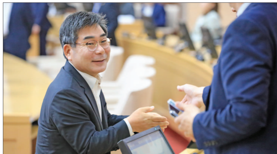
박중원 군수가 전남도의회 본회의장에서 도의원들과 인사를 나누고 있다.