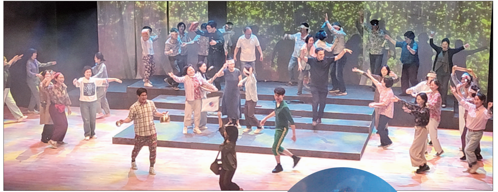
펠리체오페라단은 2일 광주예술의전당 소극장에서 제19회 정기공연으로 5·18 46주년 기념 창작 오페라 ‘무등등등26-기억의 자리’를 선보인다. 사진은 지난 ‘무등등등’ 공연 모습.

지하의 시 ‘황룻길’을 들려준다. 이어 1980년 5월 18일 아침을 배경으로 계엄군의 노래 ‘전라도 광주는 우리의 타겟’과 시민들의 목소리가 교차한다. 신경림의 시 ‘갈길’, 김준태의 시 ‘아아, 광주여’ 등이 아리아와 합창으로 선사된다.