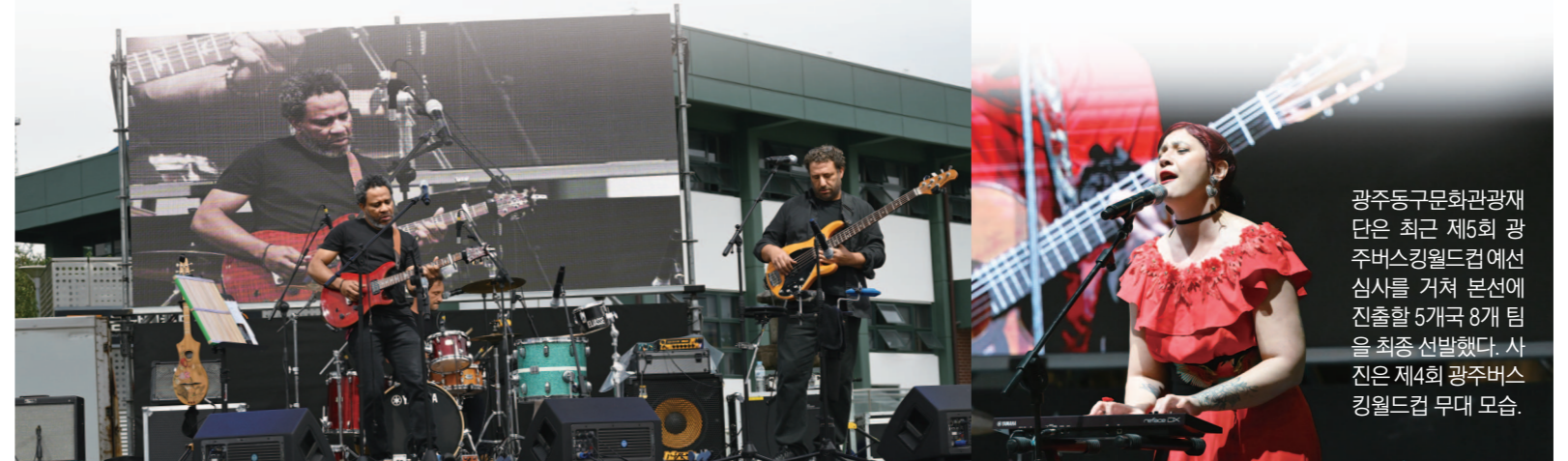
광주동구문화관광재단은 최근 제5회 광주버스킹월드컵 예선 심사를 거쳐 본선에 진출할 5개국 8개 팀을 최종 선발했다. 사진은 제4회 광주버스킹월드컵 무대 모습.