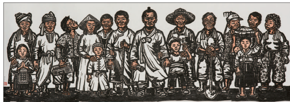
전정호 작 ‘농민들’