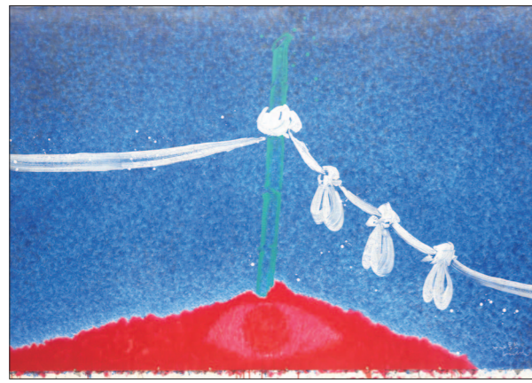
홍성담 작 ‘고풀이’