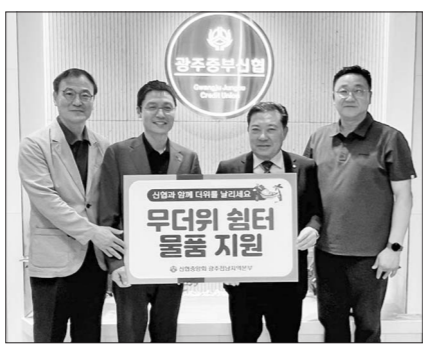
비 상향을 점검했다. 참여 조합에는 생수와 리유저블백, 왕부채 등 폭염 대응 물품이 지원되며, 주민들은 영업점 내 마련된 쉼터에서 잠시 휴식을 취하며 더위를 식힐 수 있다.

신협이 본격적인 여름철 폭염에 대비해 지역 주민들이 더위를 피할 수 있는 '무더위 쉼터'를 운영한다. 신협중앙회 광주전남지역본부는 광주·전남지역 신협을 대상으로 '무더위 쉼터' 제공을 통한 신협 홍보 캠페인'을 추진한다고 2일 밝혔다. 이번 사업은 행정안전부가 운영하는 무더위쉼터와 별도로 신협중앙회 광주전남지역본부가 자체적으로 마련한 사회공헌 활동이다. 광주·전남지역 87개 신협 가운데 64개 조합이 참여해 다음달 31일까지 영업점 내 무더위 쉼터를 운영한다. 본부는 최근 광주중부신협을 방문해 캠페인 지원 물품을 전달하고 쉼터 운영 준